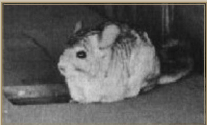
Billederne er lånt fra henholdsvis: