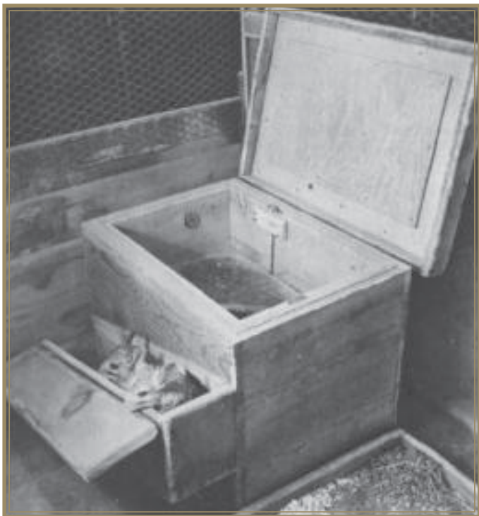
Herover: Et af Chapmans tidlige chinchilla-huse

problemer, men til sidst, efter han havde forsøgt at bygge bure, som mindede om deres naturlige miljø, begyndte det at gå bedre.