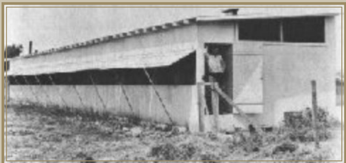
Herover: En af Chapmans første chinchilla bygninger, her beliggende i Californien.