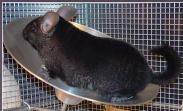
7: Meadowbrooks's chinchillaer er muskuløse og adrætte - De er næsten små atleter.

Hos Meadowbrook chinchilla opdræt, har man mange års erfaring med motion til chinchillaer. De har alle adgang til de ”flyvende tallerkner” 6 og bruger dem så flittigt, at Marty og hans hustru kan se og mærke forskel på chinchillaer der bruger hjulet dagligt, i forhold til førhen. Meadowbrooks chinchillaer er simpelthen mere faste og muskuløse, og har mere eller mindre ”chinchilla-baller” 7 af stål! ■